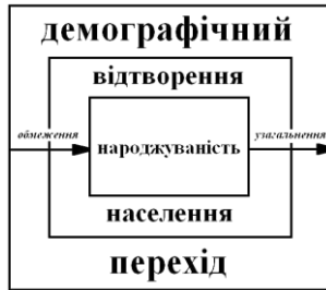
Рис. 1. Формування демографічних понять шляхом узагальнення та обмеження

багатьох елементів). Так, поняття «народжуваність» є простим у порівнянні з поняттям «демографічна політика», оскільки перше розкривається через елементарне визначення, а друге має характерні особливості багатьох процесів. Депопуляція населення України як демографічна проблема є одиничним поняттям по відношенню до демографічних проблем світу.